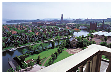
お部屋からの眺望(一例)