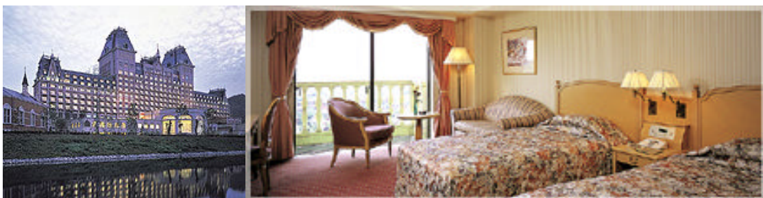
<ホテルオークラJRハウステンボス外観・客室>